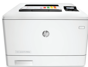
HP LaserJet Pro M452dn

Des performances d'impression idéales et une sécurité renforcée adaptées à votre façon de travailler. Cette imprimante couleur efficace accomplit les tâches plus rapidement et offre une sécurité complète pour une protection optimale contre les menaces. 1 Les toners conçus par HP avec JetIntelligence permettent d'imprimer plus de pages de haute qualité. 2